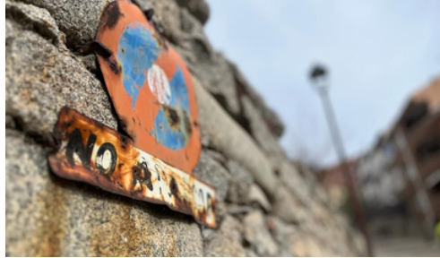
2º lugar: Lucas San Segundo