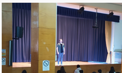
El Quijote en hora y cinco