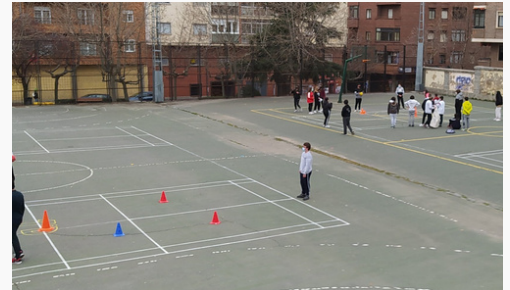
Torneo del Recolector