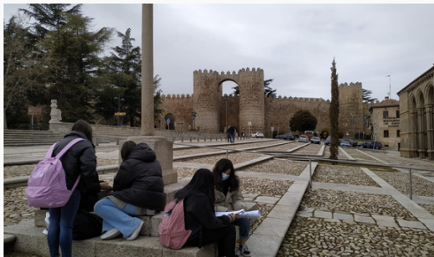
Rallye de Muraille Ávila Médiévale