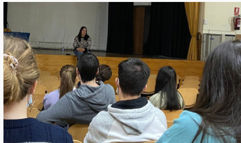
Testimonio Víctimas del terrorismo